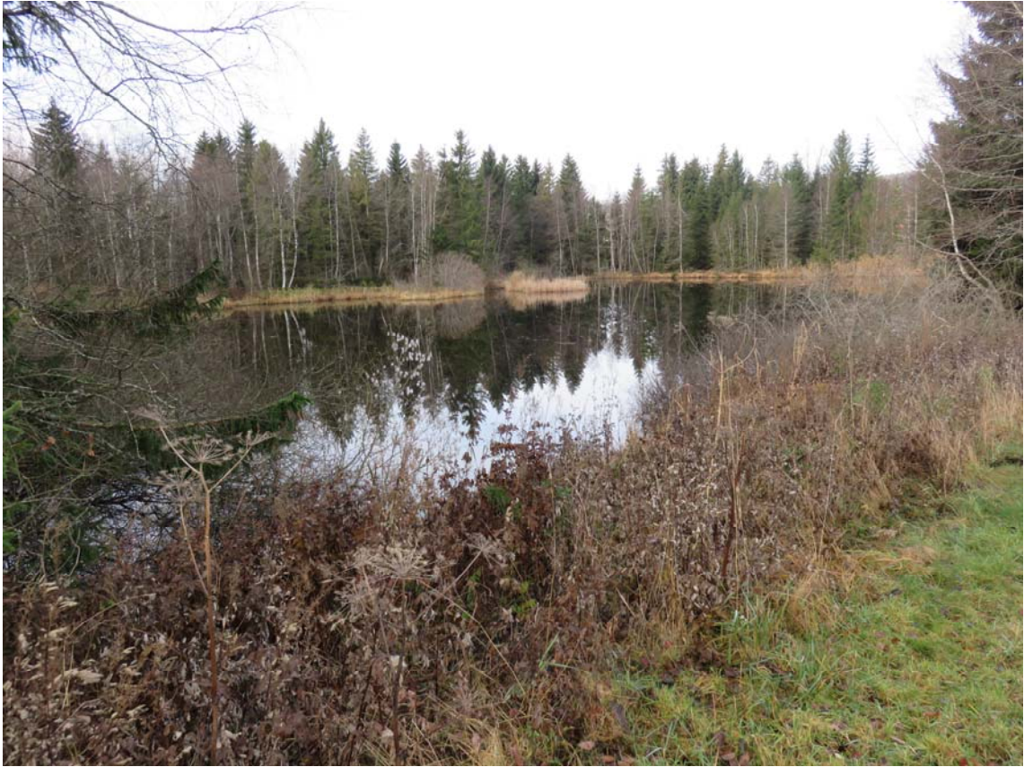
Un étang du Campe incontournable, l'un des beaux plans d'eau de la Vallée.